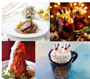
<販売メニュー・グッズ・ワークショップイメージ※一部>