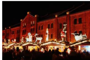
＜ヒュッテ（木の小屋）上の人形イメージ＞