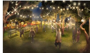
＜イルミネーションガーデンイメージ＞

今年もイベントのシンボルである高さ約 10mの生木のクリスマスツリーには、リニューアルオープンする横浜赤レンガ倉庫の明るい未来への願いを込めたゴールド&シルバーのオーナメントによる装飾と鮮やかな光が灯ります。ドイツ製ヒュッテ（木の小屋）の屋根には、ドイツから輸入したサンタ人形などのオブジェが装飾され、本場ドイツのクリスマスマーケットの雰囲気を引き立てます。また今年は横浜赤レンガ倉庫 2 号館側芝生エリアに、温かみのある光が一面に灯る「イルミネーションガーデン」が登場。クリスマスマーケットの本会場内とは異なるピッツァやミネストローネが楽しめるキッチンカー、ヨーロッパ雑貨の販売や、スノードームやキャンドル作りのワークショップが楽しめる店舗などが軒を連ね、ゆっくりくつろぐことができます。さらに日時限定で人気クラブでプレイする DJ を迎えた音楽イベントも開催。会場内が開放感溢れる屋外ラウンジ会場に様変わりし、クリスマスシーズンの夜を盛り上げる音楽をお届けします。