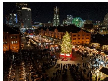
<会場イメージ※過去開催の様子>