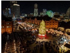
＜シンボルのクリスマスツリーイメージ＞